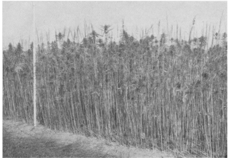
Abb. 7. Normaler Hanf.