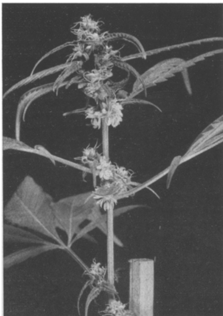
Abb. 2. Monöcische Pflanze mit weiblichem Habitus.

2. Pflanzen mit weiblichem Habitus und mit weiblichen und zwittrigen Blüten = weiblich zwittrige Pflanze.