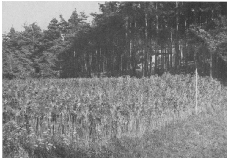
Abb. 8. Gleichzeitig reifender Hanf.

Wie steht es nun mit dem Fasergehalt der Intersexe und des gleichzeitig reifenden Hanfes?