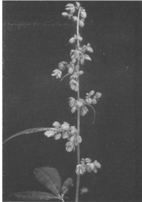
Abb. 5. Männliche Pflanze.

6. Pflanzen mit männlichem Habitus und mit weiblichen Blüten = maskulinisierte weibliche Pflanze (Abb. 6).