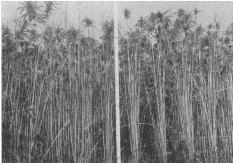
Abb. 9. Unterschied zwischen gleichzeitig reifendem und normalem Hanf. (Links des Maßstabes normaler, rechts des Maßstabes gleichzeitig reifender Hanf.)

licher Unterschied im Fasergehalt besteht. Die Schwankungen des Fasergehaltes der feminisierten Männchen sind geringer, da nur eine kleinere Anzahl von Untersuchungen vorliegt. Die Pflanzen des maskulinisierten Types haben einen etwas höheren Fasergehalt. Für die weitere züchterische Bearbeitung des gleichzeitig reifenden Hanfes sind die großen Schwankungen des Fasergehaltes von Wichtigkeit, da sie die Möglichkeit zur Steigerung des Fasergehaltes bieten. Eine Steigerung des Fasergehaltes läßt sich durch einfache Auslese erzielen, ohne daß Neueinkreuzungen von nicht gleichzeitig reifenden, faserreichen Hanfsorten notwendig sind. Arbeiten in dieser Richtung sind bereits mit gutem Erfolg im Gange.