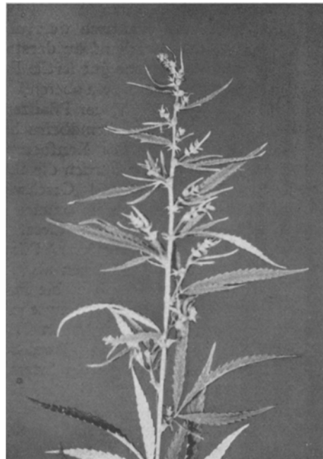
Abb. 6. Maskulinisierte weibliche Pflanze.

Das Vorkommen der geschlechtlichen Zwischentypen ist für die Züchtung eines gleichzeitig reifenden Hanfes von größter Bedeutung. Den größten Wert besitzen außer den zwittrigen und den einhäusigen Formen die Typen, die ebenso lange leben wie die weiblichen Pflanzen, bzw. die ebenso früh reifen wie die männlichen Pflanzen, d. h. also die zwittrigen und einhäusigen Formen der Typen mit männlichem und weiblichem Habitus, die feminisierten Männchen, die ebenso lange leben wie die Weib-