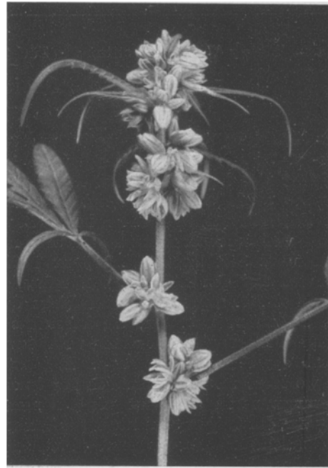
Abb. 3. Feminisierte männliche Pflanze (einige Blätter sind entfernt, um die Blütenstellung besser zu zeigen).

3. Pflanzen mit weiblichem Habitus und mit weiblichen, zwittrigen und männlichen Blüten